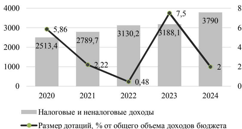
Рис. 2. Зависимость объёма дотаций и налоговых доходов г. Таганрога

Для оценки потенциала изменения объёма дотаций проанализируем их фактические значения, а также динамику налоговых доходов бюджета г. Таганрога за отчётный период 2020–2024 гг. (рис. 2).